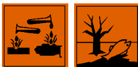
C - Corrosif